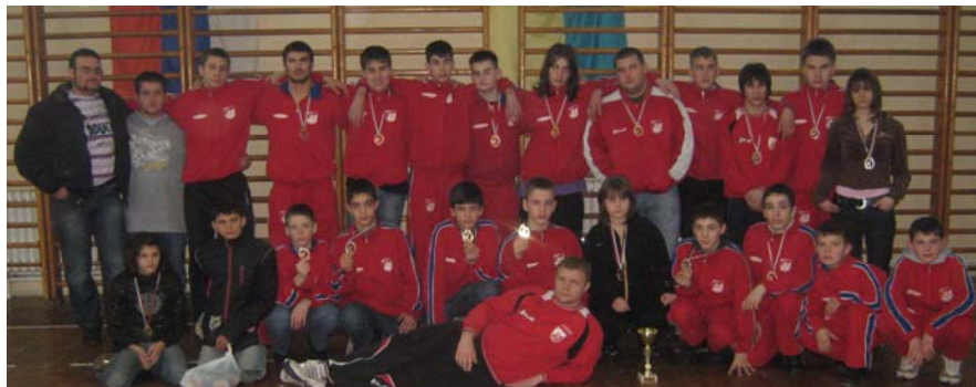
Slika R..K.Radničkog koji je ekipno bio prvi u konkurenciji st.pionira

Žao mi je što vas ne mogu izvestiti sa ovog takmičenja pošto opet neko sebi daje za pravo da jedno PRVENSTVO DRŽAVE SRBIJE I TO U DVE UZRASNE KATEGORIJE I TO SA 120 takmičara nestavi na SAJT R.S.S.